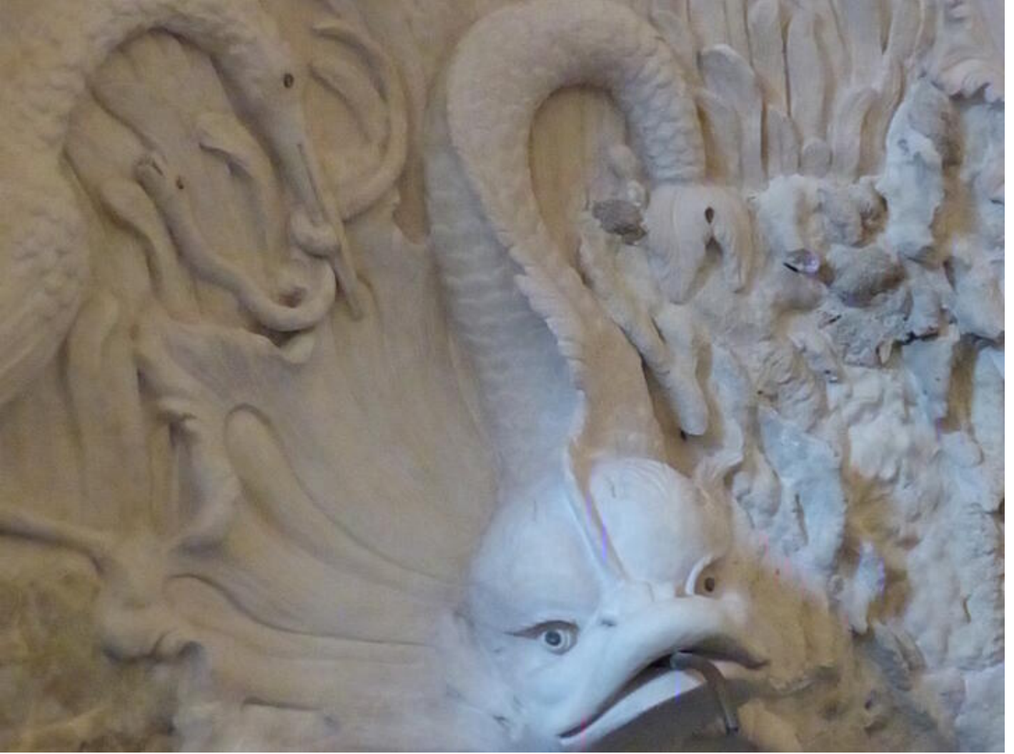
Visite guidée Saint-Antoine au fil du temps - Le temps de la curiosité : curiosités minérales ou a 38160 Saint-Antoine-l'Abbaye

Visite permettant de découvrir des espaces qui ne sont pas ouverts au public.